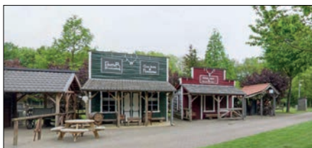
Westernschiessen im Schietsportcentrumstein (NL)

In Euskirchen findet einmal im Jahr das Bärenschießen des VSV-Köln statt, hier wird natürlich nicht auf echte Bären geschossen. Hier finden die Wettbewerbe mit Vorderladerlangwaffen, Westernwaffen und Unterhebelrepetierern auf 50m und 100m Bahnen statt. Für die Freunde des Wilden Westens: